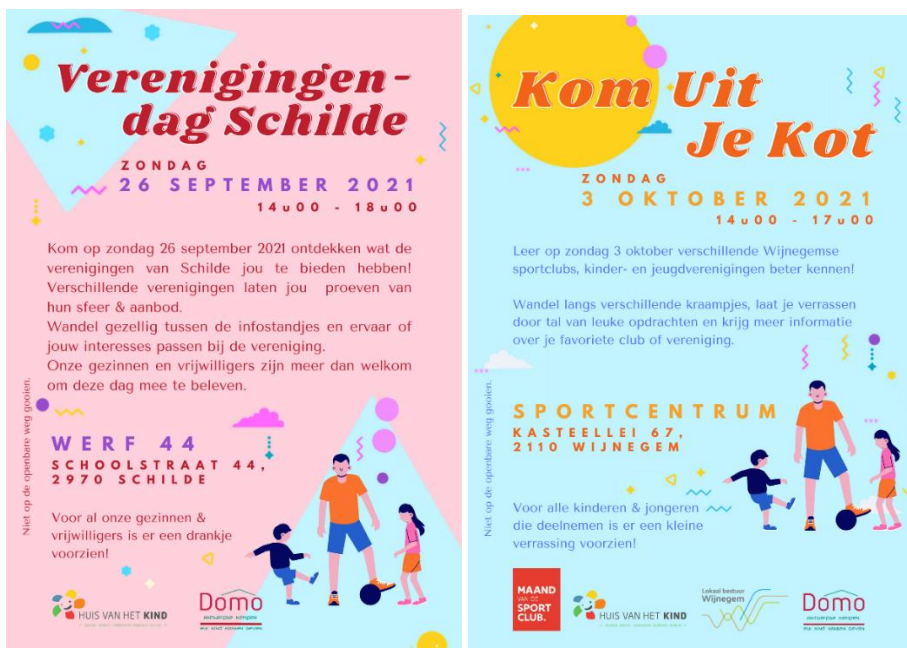
Flyers verenigingsdag Schilde en Wijnegem