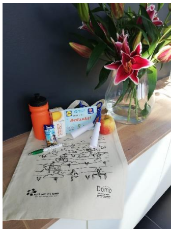
Goodiebag (outreachend werken)