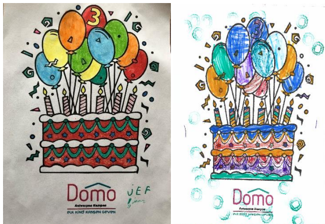
Tekeningen drie jaar Domo