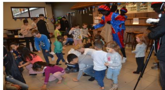
Het eerste sinterklaasfeest van DOMO Voorkempen vond plaats in Sint-Antonius Zoersel.

ZOERSEL De vrijwilligersorganisatie DOMO (Door Ondersteuning Mee Opvoeden) schenkt ook zijn overig speelgoed van het afgelopen sinterklaasfeest aan kansarme gezinnen. Door die actie wil de vrijwilligersorganisatie ook kinderen die niet aanwezig konden zijn een sinterklaasgeschenkje bezorgen.